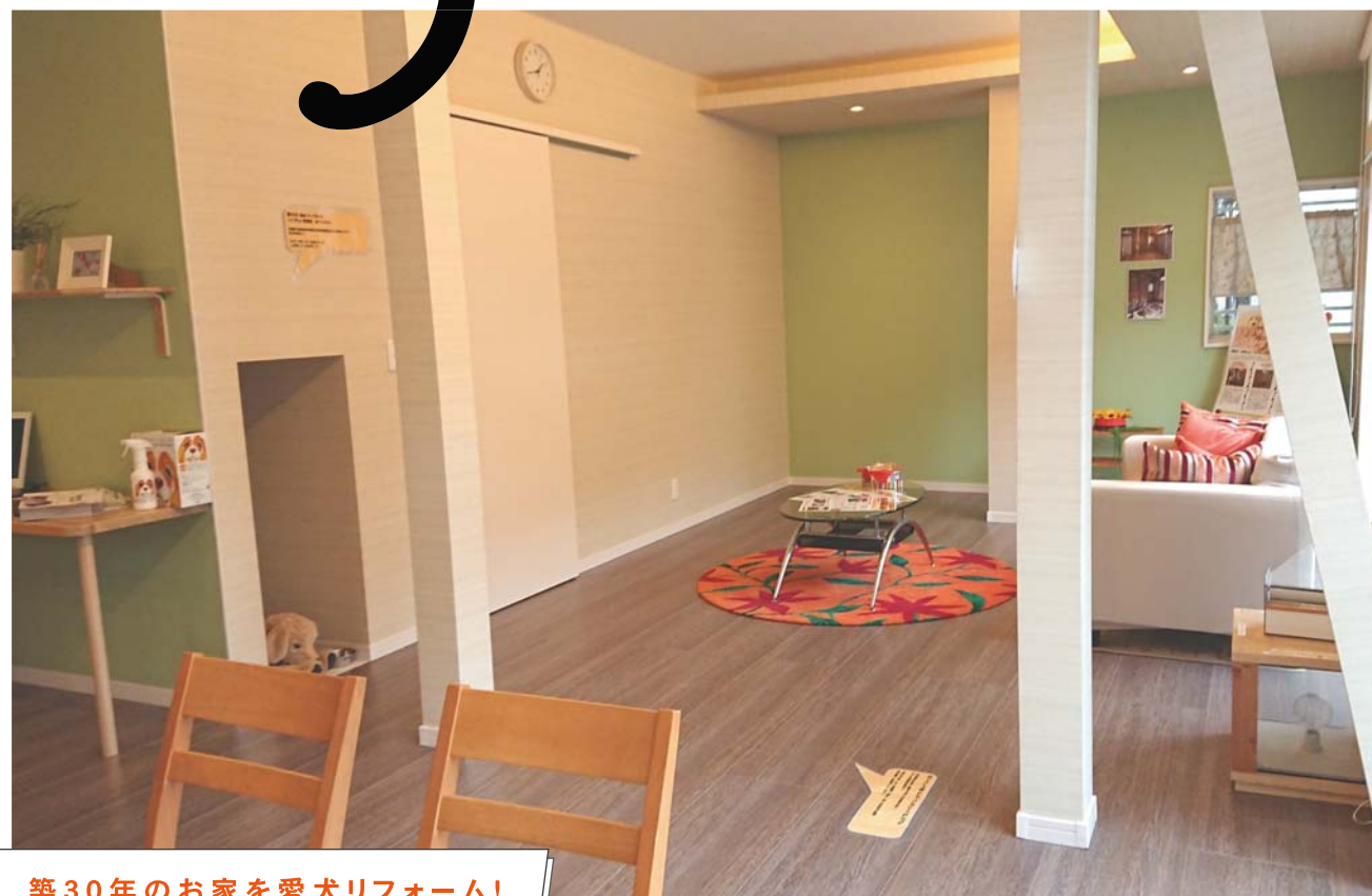
築30年のお家を愛犬リフォーム!